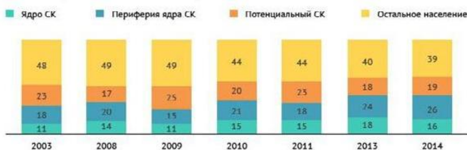
Рис. 1. Состав среднего класса в России за период 2003–2014 гг., % [1] / Fig. 1. Composition of the middle class in Russia for the period 2003–2014, % [1]

В структуре всего населения России, как следует из работы А. Борисова, доля среднего класса за десятилетие 2003–2014 гг. возросла с 29 % в 2003 г. до 42 % в 2013–2014 гг. (рис. 1), однако к 2018 г. она сократилась до 37,7 % – ядро среднего класса составляет примерно 7 % населения, периферия ядра – 11,2 % и потенциальный средний класс – 19,5 % [1]. Сокращение среднего класса в 2018 г. можно объяснить существенным уменьшением периферии его ядра.