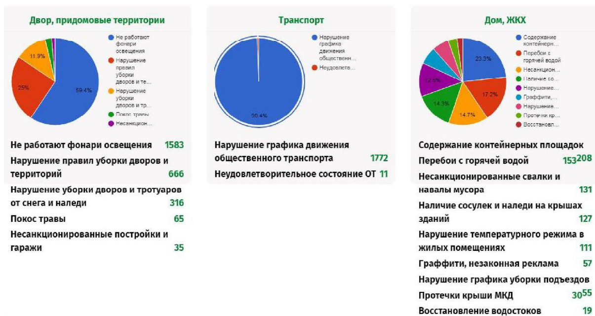
Рис. 2. Статистика обращений на портале «Делаем вместе» / Fig.2. Statistics of appeals on the portal "Doing Together"

выявленных в функционировании данного проекта, можно выделить то, что на выполнение работ любого характера ответственному исполнителю дается 10 дней, вне зависимости от сложности работ. Условно: на выполнение ямочного ремонта асфальтобетонного покрытия дается столько же времени, сколько и на спил аварийного дерева. В связи с этим возникают ситуации для одновременного возврата обращения гражданина и регистрации повторного.