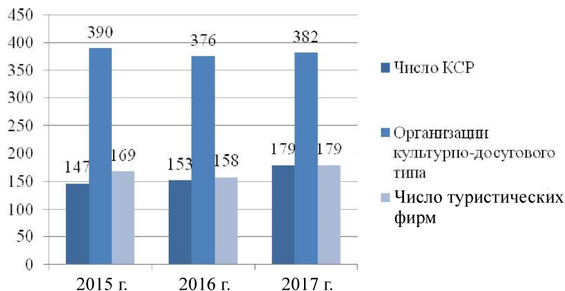
Рис. 3. Основные показатели туристской деятельности в малых городах Тульской области (составлено по данным [20]) / Fig. 3. Main indicators of tourist activity in small towns of Tula region (compiled from data [20])

2017 г. Число коллективных средств размещения незначительно снизилось, что в целом не оказывает значительного влияния на туристскую инфраструктуру.