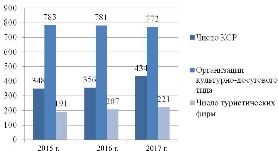
Рис. 2. Основные показатели туристской деятельности в малых городах Пермского края (составлено по данным [20]) / Fig. 2. Main indicators of tourist activity in small towns of Perm region (compiled from data [20])