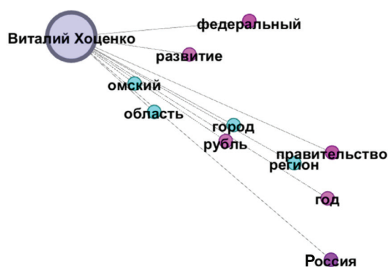
Рис. 2. Сетевой граф семантической направленности постов кандидата в губернаторы Виталия Хоценко / Fig. 2. Network graph of semantic orientation of Vitaly Khotenko posts as a candidate for governor

Кандидат в губернаторы Виталий Хоценко старается максимально привлечь элек-