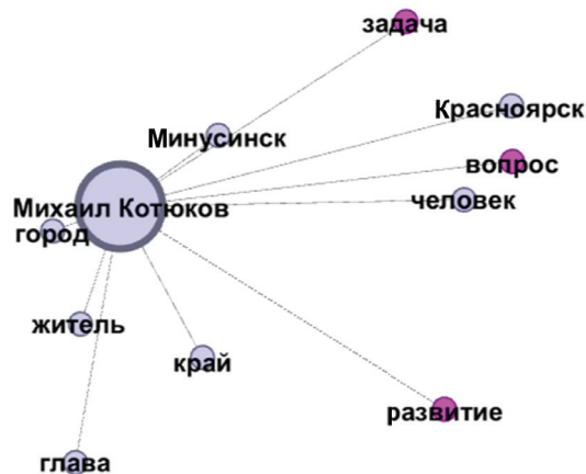
Рис. 3. Сетевой граф семантической направленности постов кандидата в губернаторы Михаила Котюкова / Fig. 3. Network graph of semantic orientation of Mikhail Kotyukov posts as a candidate for governor

Основным тематическим наполнением сетевого графа кандидата в губернаторы Красноярского края Михаила Котюкова является ориентация политика на интересы каждого жителя Красноярска, Минусинска и других населённых пунктов Красноярского края (рис. 3).