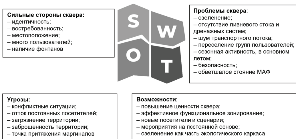
Рис. 3. Результаты SWOT-анализа по отношению местных жителей к скверу «Радуга» в г. Улан-Удэ / Fig. 3. Results of a SWOT analysis of the local residents' attitude to the Raduga Garden Square in Ulan-Ude

На основе опроса с помощью технологии SWOT-анализа получены данные, приведённые на рис. 3.