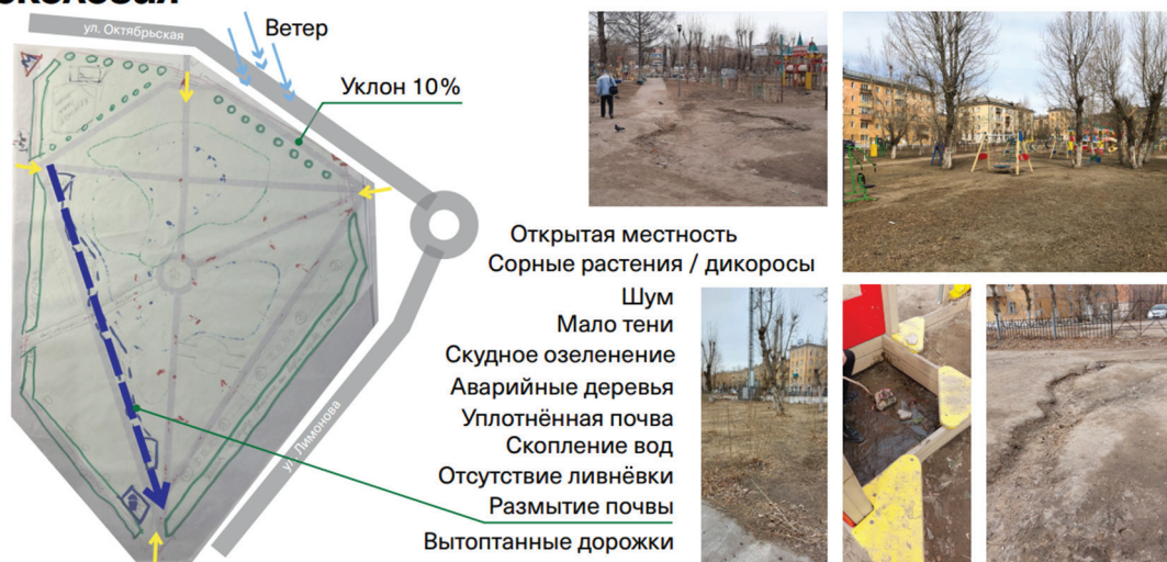
Рис. 2. Геоэкологические проблемы сквера «Радуга» в г. Улан-Удэ / Fig. 2. Geoeological problems of the Raduga Garden Square in Ulan-Ude

Общая площадь сквера составляет 3232 м 2 .