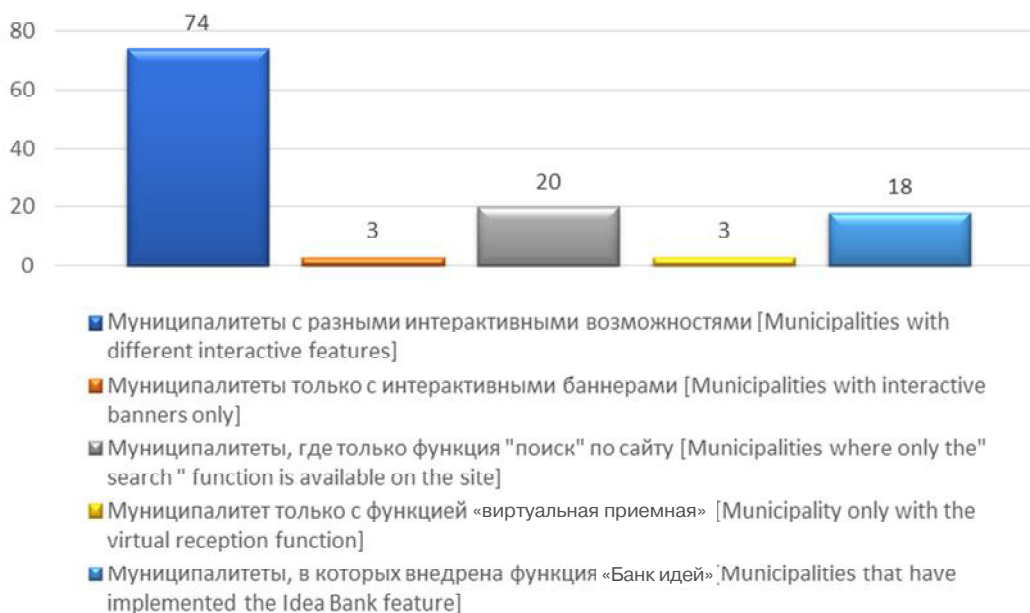
Рис. 3. Наличие интерактивных возможностей на сайте муниципалитета / Fig. 3. Availability of interactive features on the municipality's website