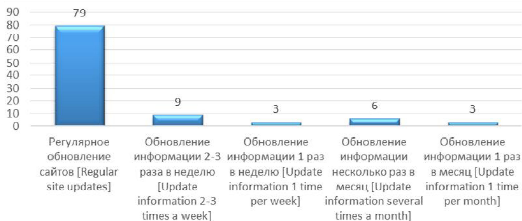
Рис. 2. Регулярность обновления новостей на сайтах муниципалитетов / Fig. 2. Regular updates of news on the websites of municipalities

Отдельно отметим наличие на сайтах шести муниципалитетов (Анжеро-Судженский городской округ, Беловский городской округ, Березовский городской округ, Кемеровский муниципальный округ, Юргинский муниципальный округ, Яйский муниципальный округ) раздела «Банк идей» для граждан муниципалитета.