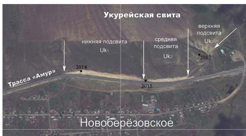
Рис. 3. Положение подсвит укурейской свиты гипостратотипа-1 на космическом снимке

Средняя подсвита изучена по разрезам т.н. 2015, 2016, 2017 (рис. 2; 3).