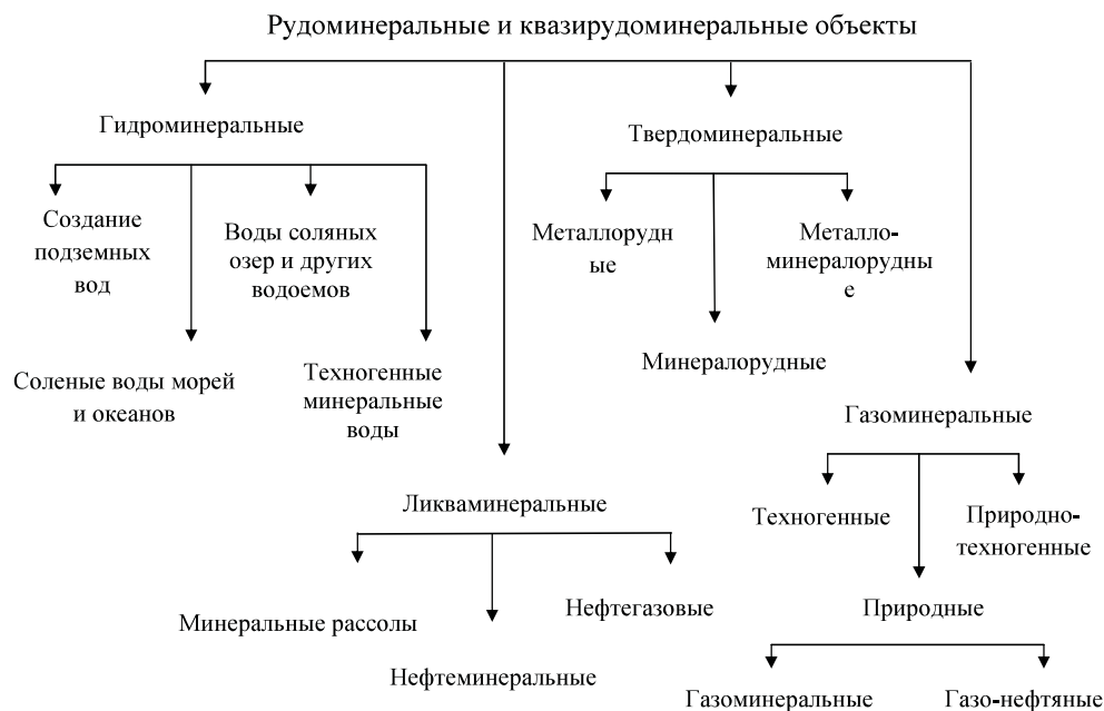
Рис. 3. Системный комплекс рудо-минеральных и квази-рудо-минеральных объектов Fig. 3. System complex of ore-mineral and quasi-mineral-mineral objects

агрегатного состояния представляется необходимым и целесообразным систематизировать по их основным типам (рис. 3).